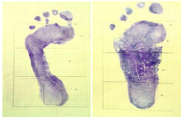
Gambar 1. Hasil footprint pada kedua jenis lengkung kaki atlet basket (A, arcus normal; dan B, pes planus plantaris).

yang bekerja ketika beraktivitas, peningkatan berat badan, dan kelemahan struktur penyusun plantar, berpotensi menurunkan tingkat kelengkungan lengkung kaki, dan pada akhirnya akan memurunkan kelengkungan arcus longitudinalis medialis plantaris. 20